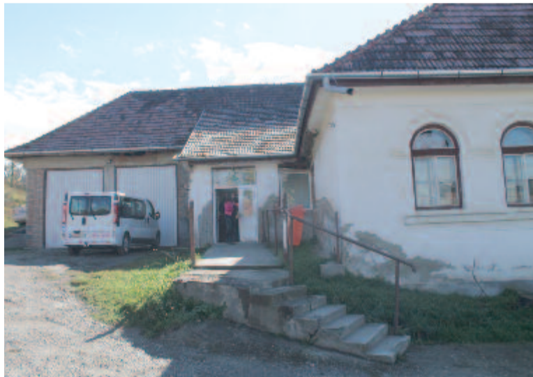
A backamadarasi orvosi rendelő