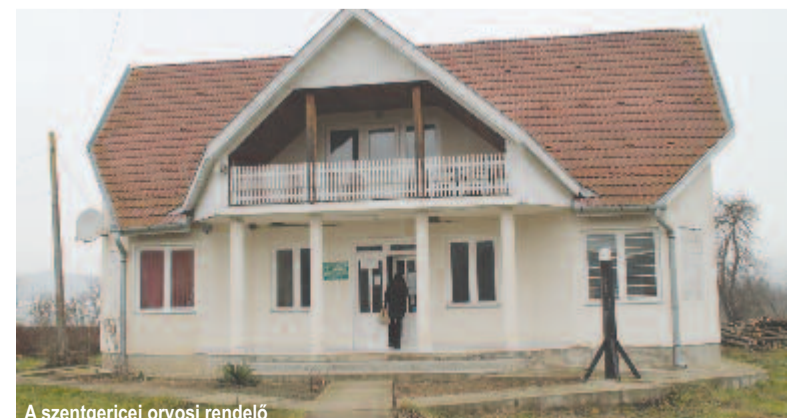
A szentgericei orvosi rendelő

Az amerikai jótévedők, akikkel a helyi unitárius egyház áll kapcsolatban, elsősorban a diákokat támogatják, ezáltal szeretnék ösztönözni őket arra, hogy folytassák tanulmányaikat. Azok a fiatalok, akik a nyolcadik osztály elvégzése után továbbtanulnak, egy tanévben ezer-ezeröttszáz lejes támogatásban részesülnek.