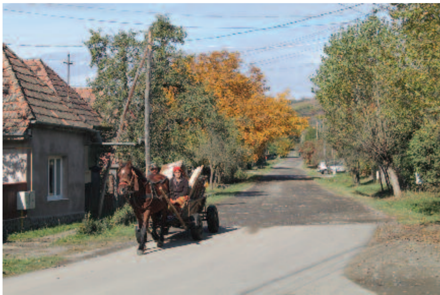
A Középszeg utca

A polgármesteri hivatal udvarán lévő épület, amely a gyógyszertárnak, valamint az orvosi rendelőnek ad otthont, nem felel meg ennek a rendeltetésnek. Nincsen illemhely, az idős emberek számára nehezen megközelíthető, ezért el kellene költöztetni egy olyan helyszínre, ahol megfelelő körülmények között tudnák fogadni a pácienseket – véli a polgármester. – Madaras központjában a régi kultúrotthon épülete, ahol jelenleg a falumúzeum van, megfelelő lenne erre a célra. Ha találnának egy új helyszínt a falumúzeumnak, esetleg egy régi, tornácos házat, akkor felújítanák az épületet és oda költöztetnék az orvosi rendelőt, a patikát, és esetleg fogorvosi rendelőt is lehetne ott nyitni – számolt be a terveiről a polgármester.